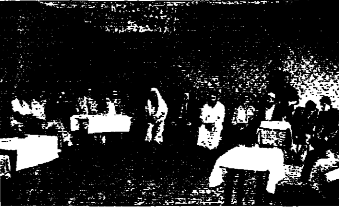
القيادات الطرابلسية خلال اجتماعها في ليلنا

أكدت هذه القيادات في وقت سابق في بيانها ان طرابلس هي مدينة سلمية ومن ثم نلقت في طرابلس في سري زغرتا وتسلم المواطنين الزغرتانيين في ثكنة الجيش في القبة وتلقاهم في ثم ان زغرتا وفق ما تقر في ضوء الاتصالات.